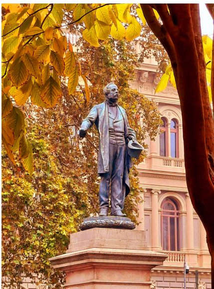
Le statue di Bologna

Lettera del Governatore..... pag. 15 Gruppo Felsineo ..... pag. 16