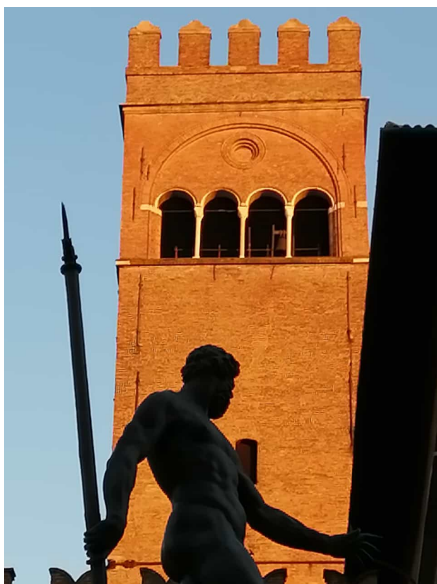
Le statue di Bologna

Ricordiamo che per l’accesso alle conviviali è richiesta l’esibizione del **Super Green Pass** , come da normativa anti-Covid vigente. Il Green Pass può essere stampato in maniera chiara o esibito sul dispositivo mobile. Il controllo verrà sempre effettuato all’ingresso della struttura.