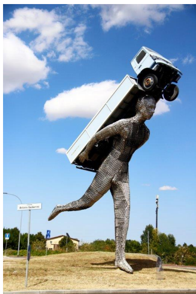
Le statue di Bologna

Rotonda Antonio Gasbarrini Monumento al Camionista