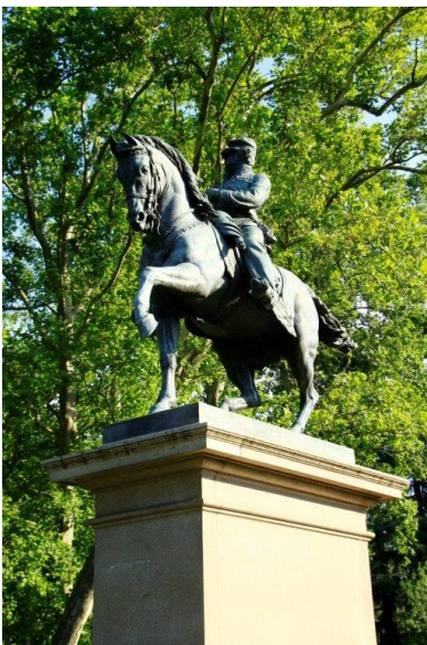
Le statue di Bologna

Giardini Margherita Vittorio Emanuele II