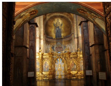
La Vergine Orante di Kiev