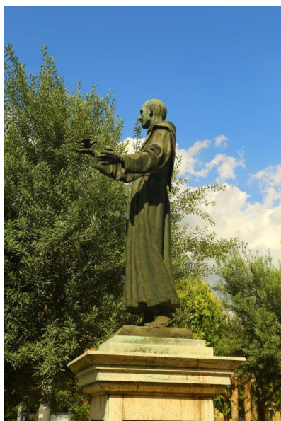
Le statue di Bologna