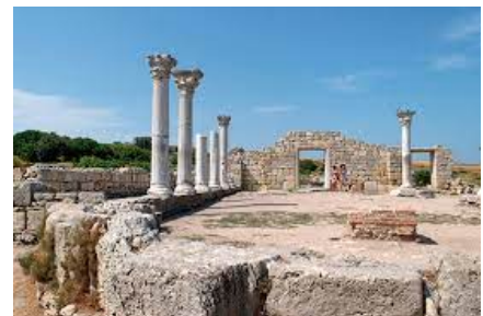
Il parco archeologico di Cherson