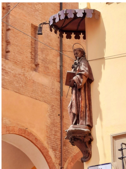
Le statue di Bologna

Via C. Battisti ang. Via Porta Nova S. Antonio da Padova