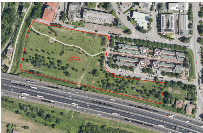
Planimetria Giardino Paul Harris

Invito tutti i soci a presenziare alla cerimonia a suggello di questo importante successo del R.C. Bologna Ovest G Marconi.