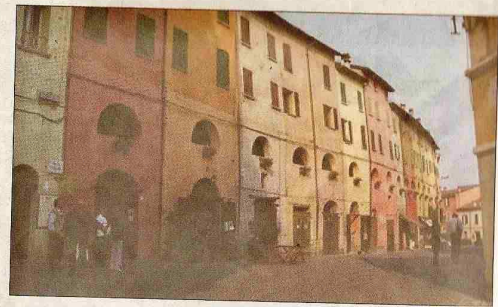
Il centro storico di Brisighella, i cui cittadini sono stati scelti per la ricerca medica