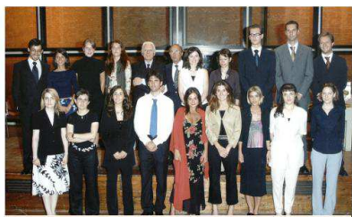
Gli studenti premiati (anno 2003) insieme al Governatore del Distretto 2070 e al Rettore dell'Università di Bologna

Nel prossimo mese di giugno verrà consegnato l'ormai tradizionale Premio di Laurea al miglior laureato di ciascuna Facoltà dell'Università di Bologna nello scorso anno accademico.