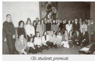
Gli studenti premiati

Nel corrente anno la cerimonia di consegna si è tenuta il giorno 8 maggio, presso lo stabilimento della Ducati Motor. Gli studenti premiati hanno partecipato accompagnati da un Rappresentante dell'Istituto Scolastico e da alcuni familiari e amici. I Club hanno partecipato con il Presidente e con numerosi soci.